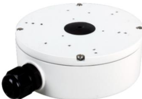
A22 (распред коробка)